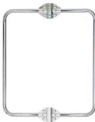
Bügel-Set zu SAM