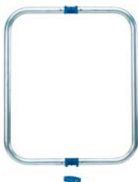
Aufsteckrahmen zu SAM