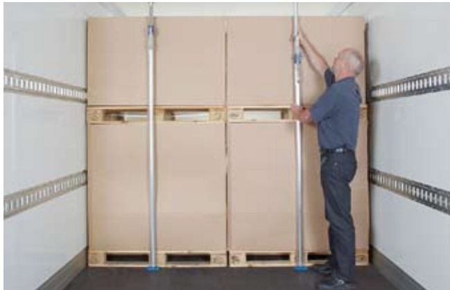
Sicherung von palettiertem Ware – vertikal