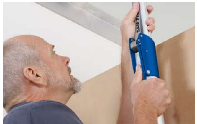
Einfache und schnelle Bedienung