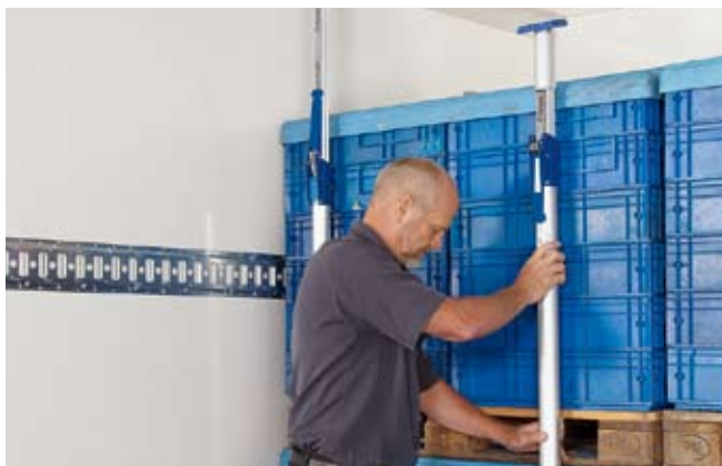
Sicherung von palettiertem Ware – vertikal