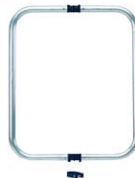
Aufsteckrahmen zu SAM Profi