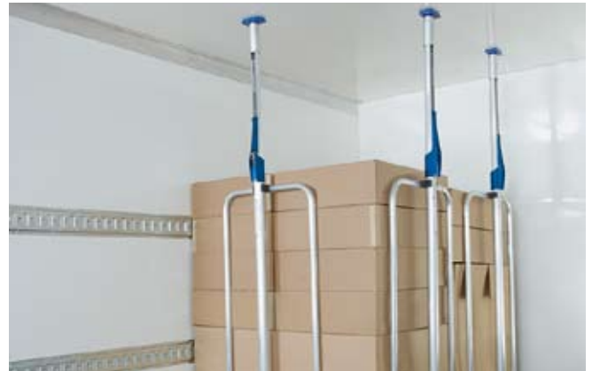
Sicherung mit Aufsteckrahmen